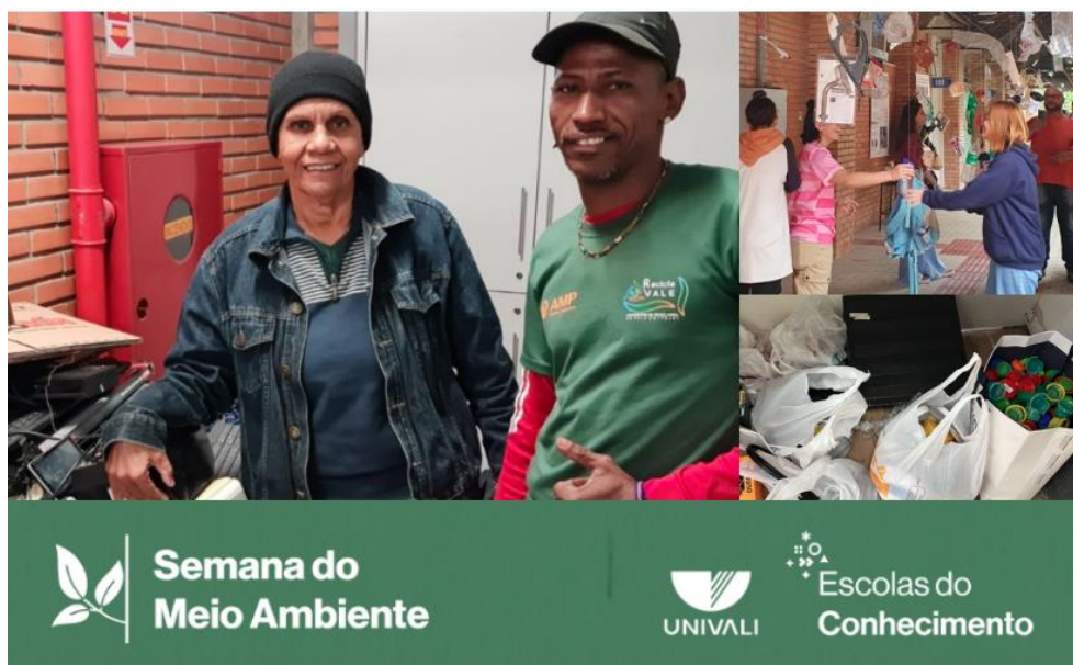
Figura 3: Registro da entrega de parte dos materiais arrecadados - Semana do Meio Ambiente